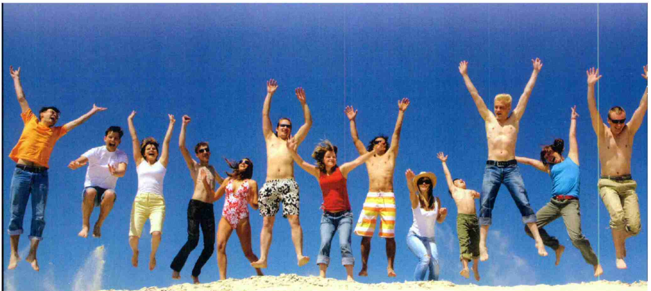
Strand, Sonne, Meer und Sprache: das Nützliche mit dem Angenehmen verbinden.

Die richtige Wahl des Ferienziels und der geeigneten Sprachschule sind bei der Kombination von Ferien mit einem Sprachaufenthalt besonders wichtig. Beides soll die Bedürfnisse der Lernfreudigen abdecken. Die Schule wie der Ort, der Kurs wie das Sport-, Kultur- und Unterhaltungsangebot sollten genau auf die Wünsche und Erwar-